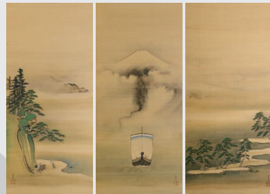
谷文晁筆 富士越龍・三保松原・東下り図 個人蔵