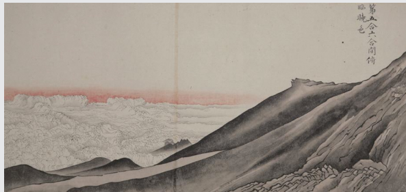
谷文晁筆 富士山中真景全図 部分 静岡県富士山世界遺産センター