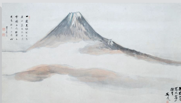
谷文晁筆 谷麓谷賛 富士山図 静岡県富士山世界遺産センター