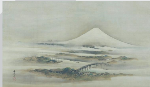
谷文晁筆 富士図 三溪園（山口八十八コレクション） 12/7-1/9 展示予定