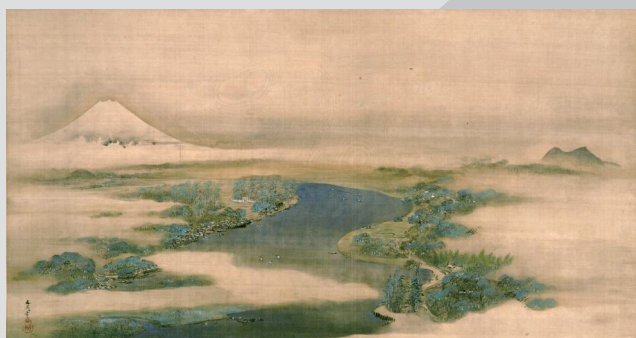
谷文晁筆 隅田川兩岸図 群馬県立近代美術館（戸方庵井上コレクション） 1/11-2/2 展示予定